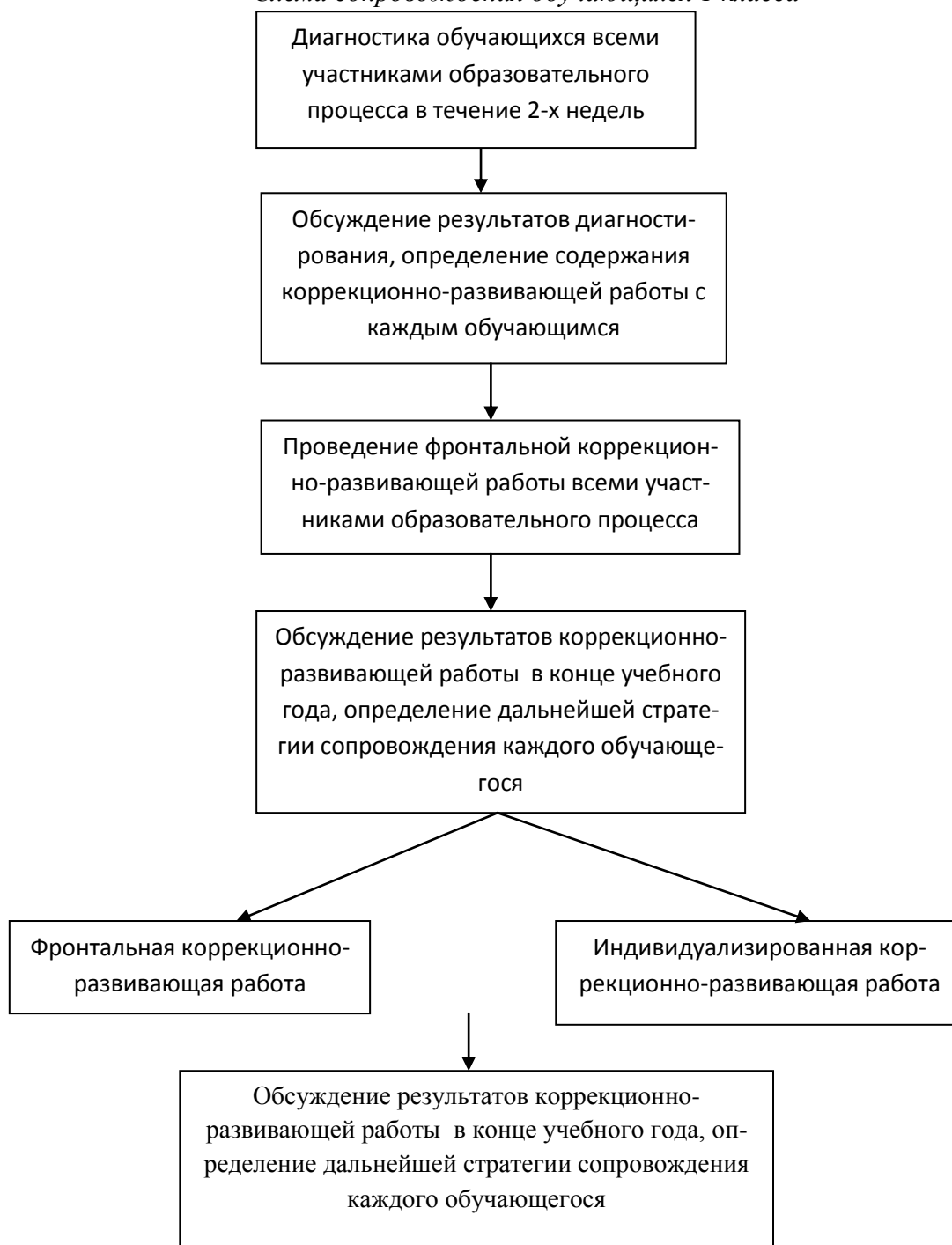
Схема сопровождения обучающихся 1 класса

Этап регуляции и корректировки (регулятивно-корректировочная деятельность). Результатом является внесение необходимых изменений в образовательный процесс и процесс сопровождения детей с ОВЗ, корректировка условий и форм обучения, методов и приёмов работы.