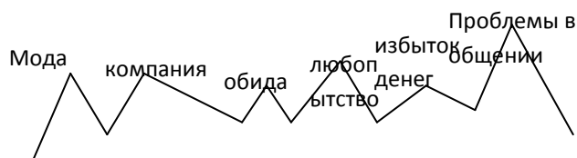
Рисунок 1 – Основные причины наркозависимости.

Таким образом, давайте сделаем общий вывод, подведём итог. Возникновение наркомании зависит от самого человека, от двух причин: